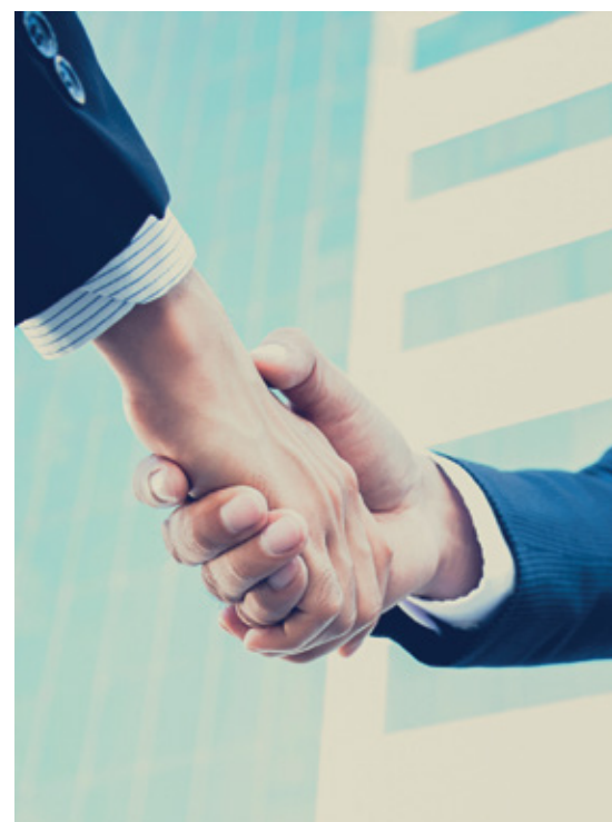
*Gastos sujetos a las políticas y restricciones de viaje de Food Export

Las Misiones de Compradores de Food Export, son plataformas de enlace personal entre compradores internacionales y proveedores de alimentos de los Estados Unidos. Estos eventos se llevan a cabo durante todo el año y constantemente se organizan en conjunto con exposiciones de alimentos en los Estados Unidos, por ejemplo: The Fancy Food Show en Nueva York y San Francisco, el Sweets and Snacks Expo en Chicago y las Exposiciones de Productos Naturales y Orgánicos: Expo East y Expo West en Anaheim y Baltimore.